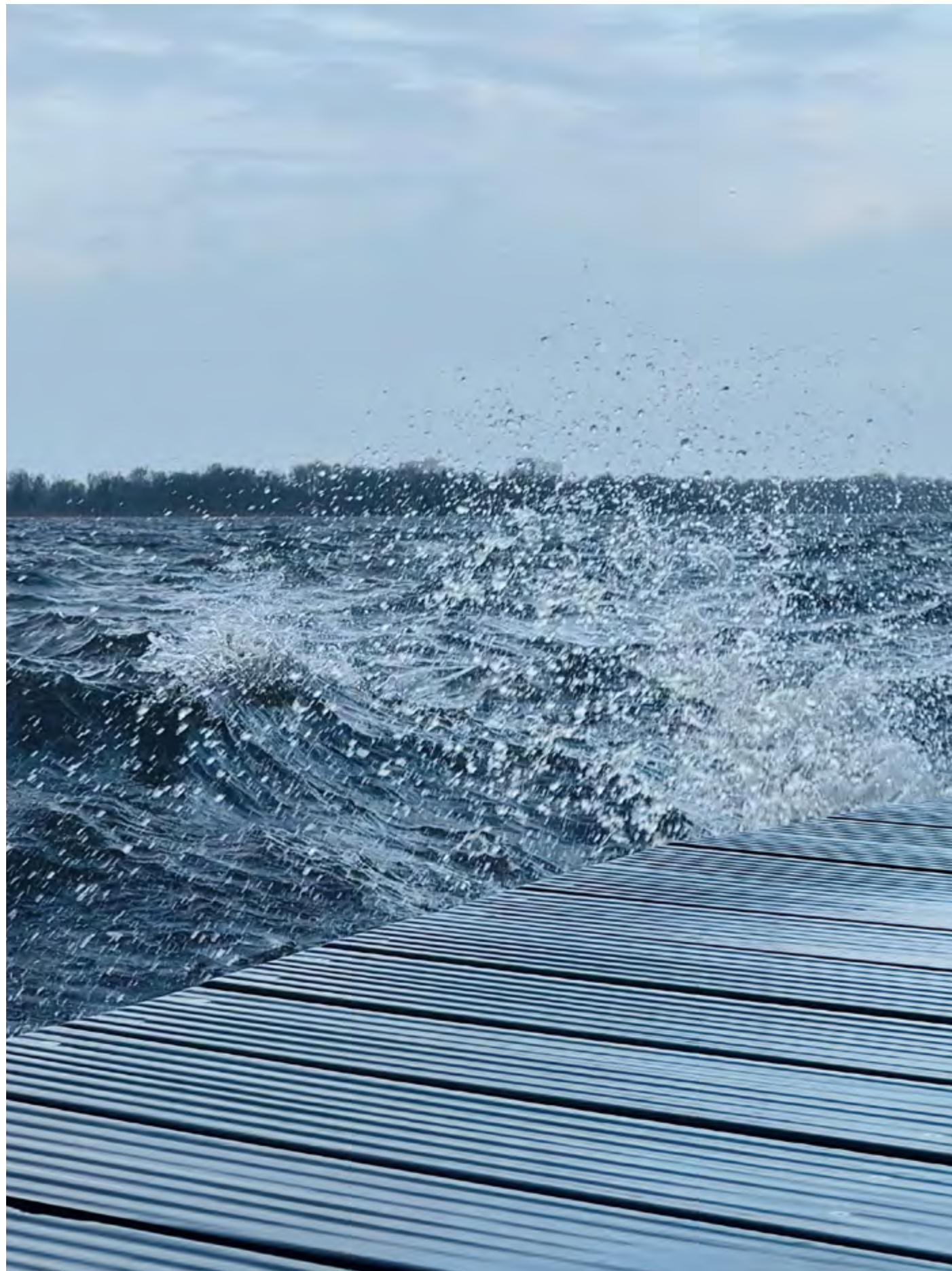
Storm op het Paterswoldsemeer