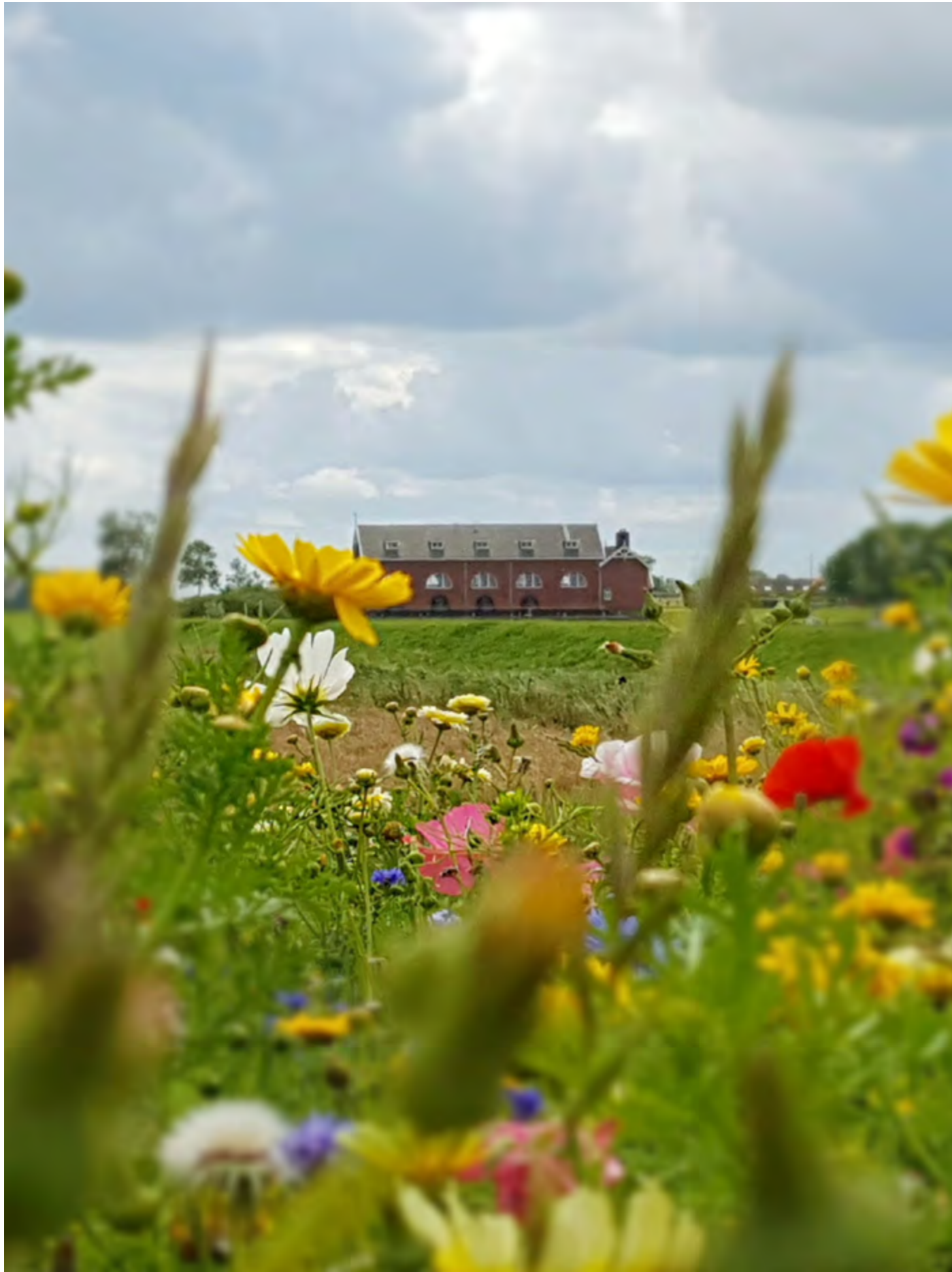
Akkerrand met op de achtergrond het gemaal De Waterwolf aan het Reitdiep