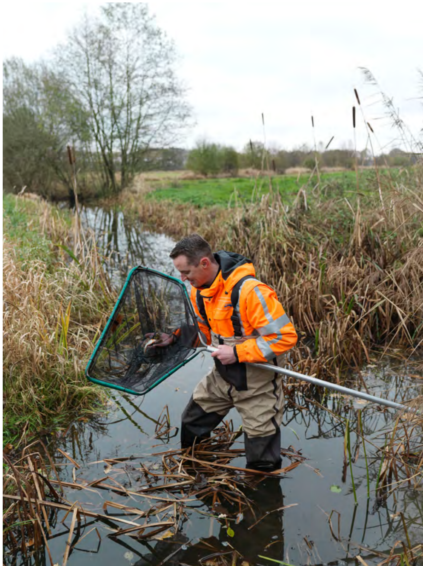
Vismonitoring in de watergebieden voor een goede vismigratie