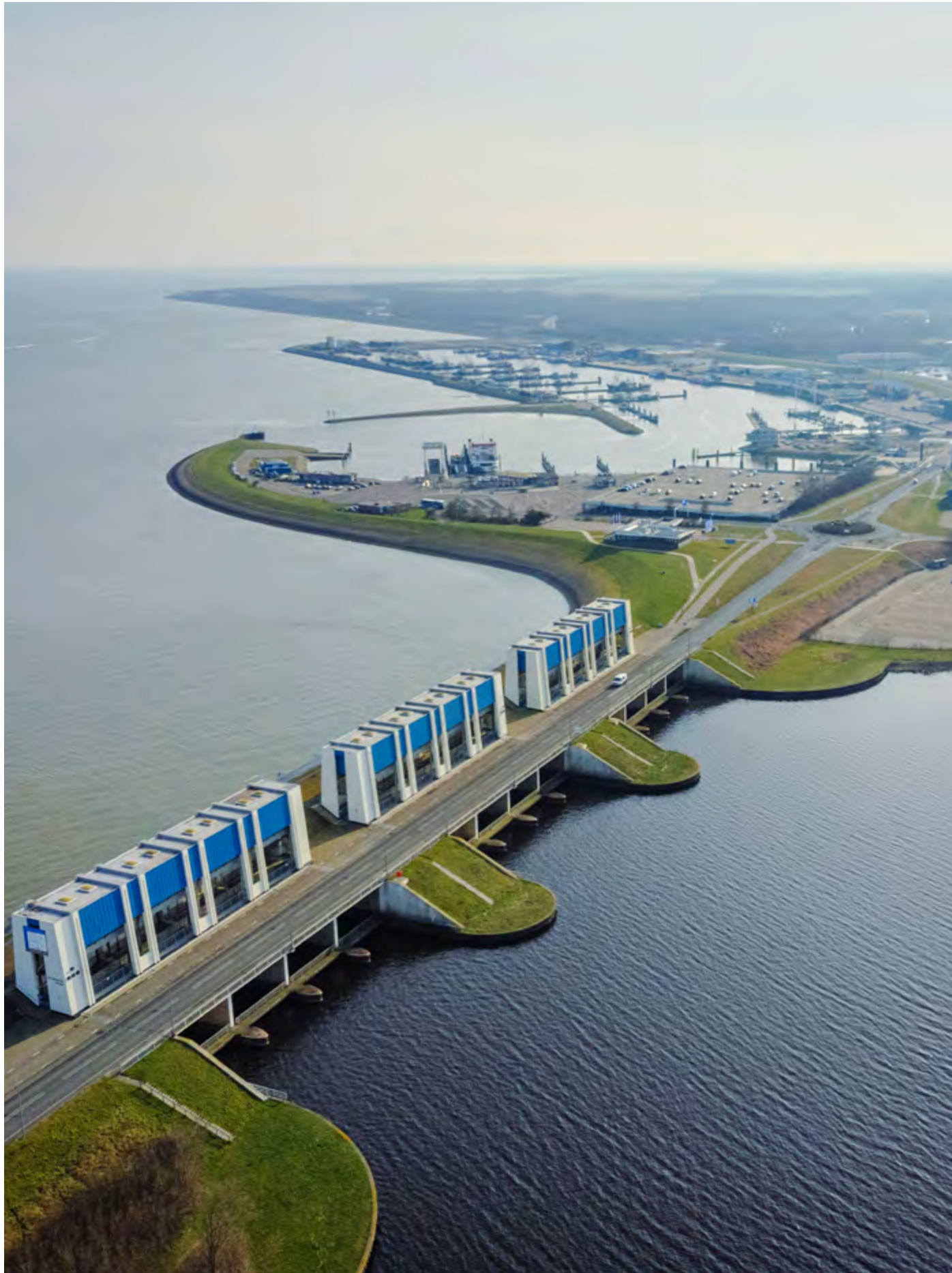
De R.J. Cleveringsluizen, het spuisluizencomplex bij Lauwersoog