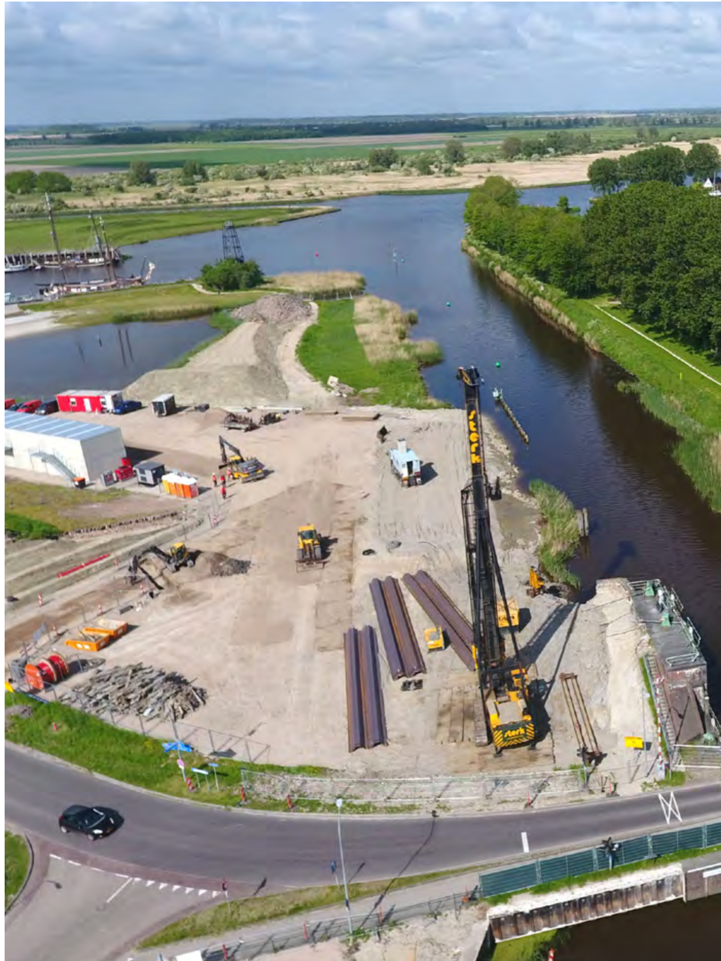
Het project 'Nieuwe Waterwerken Zoutkamp'