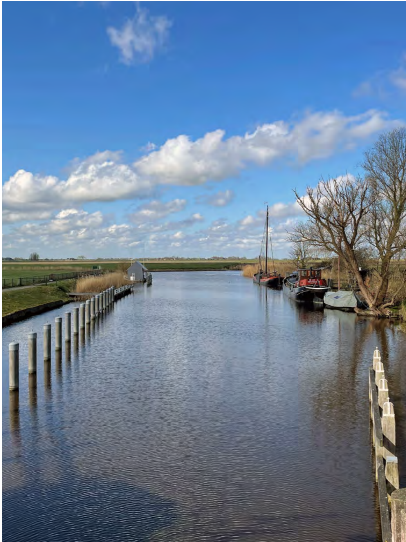
Het Reitdiep bij Schaphalsterzijl