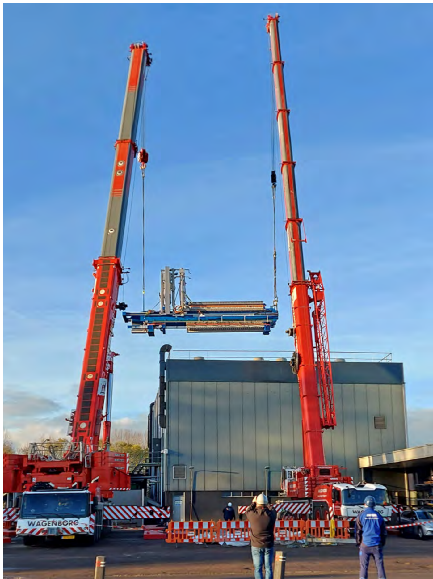
Het plaatsen van filterpompen in Garmerwolde